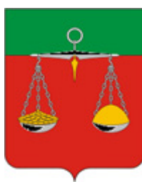
Старозюринская сельская библиотека- филиал № 14 МБУ – Межпоселенческая б ибблиотека Тюлячинского муниципального района Республики Татарстан