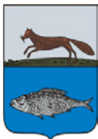
Подгорненская сельская библиотека-филиал № 25 МБУК «Межпоселенческая центральная библиотека» Бугульминского муниципального района Республики Татарстан

В 2021 году от региона в конкурсе приняли участие, как и в предыдущие годы, 20 общедоступных библиотек. Участникам не удалось набрать необходимое количество баллов для прохождения конкурса, но в рамках дополнительного набора была отобрана Подгорненская сельская библиотека Бугульминского муниципального района Республики Татарстан. Библиотека получила финансовую поддержку из федерального бюджета в размере 5 млн рублей.