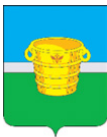
Кубасская сельская библиотека-филиал № 16 МБУК «Чистопольская межпоселенческая центральная библиотека» Чистопольского муниципального района Республики Татарстан

В октябре – ноябре 2022 года состоялось открытие этих пяти модернизированных библиотек.